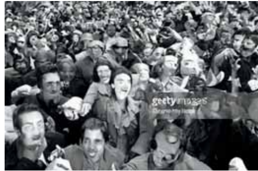
Een afbeelding gemaakt door/met Stable Diffusion waarin 'Getty Images' watermerk zichtbaar is.

Mocht het resultaat op grond van een te grote gelijkenis met bestaand werk inbreuk maken, dan is er wat het gebruik van dat resultaat betreft nog geen probleem zolang dat resultaat is verkregen voor 'eigen oefening, studie of gebruik' 38 of voor gebruik binnen de 'familie-, vrienden- of daaraan gelijk te stellen kring'. 39 Openbaarmaking