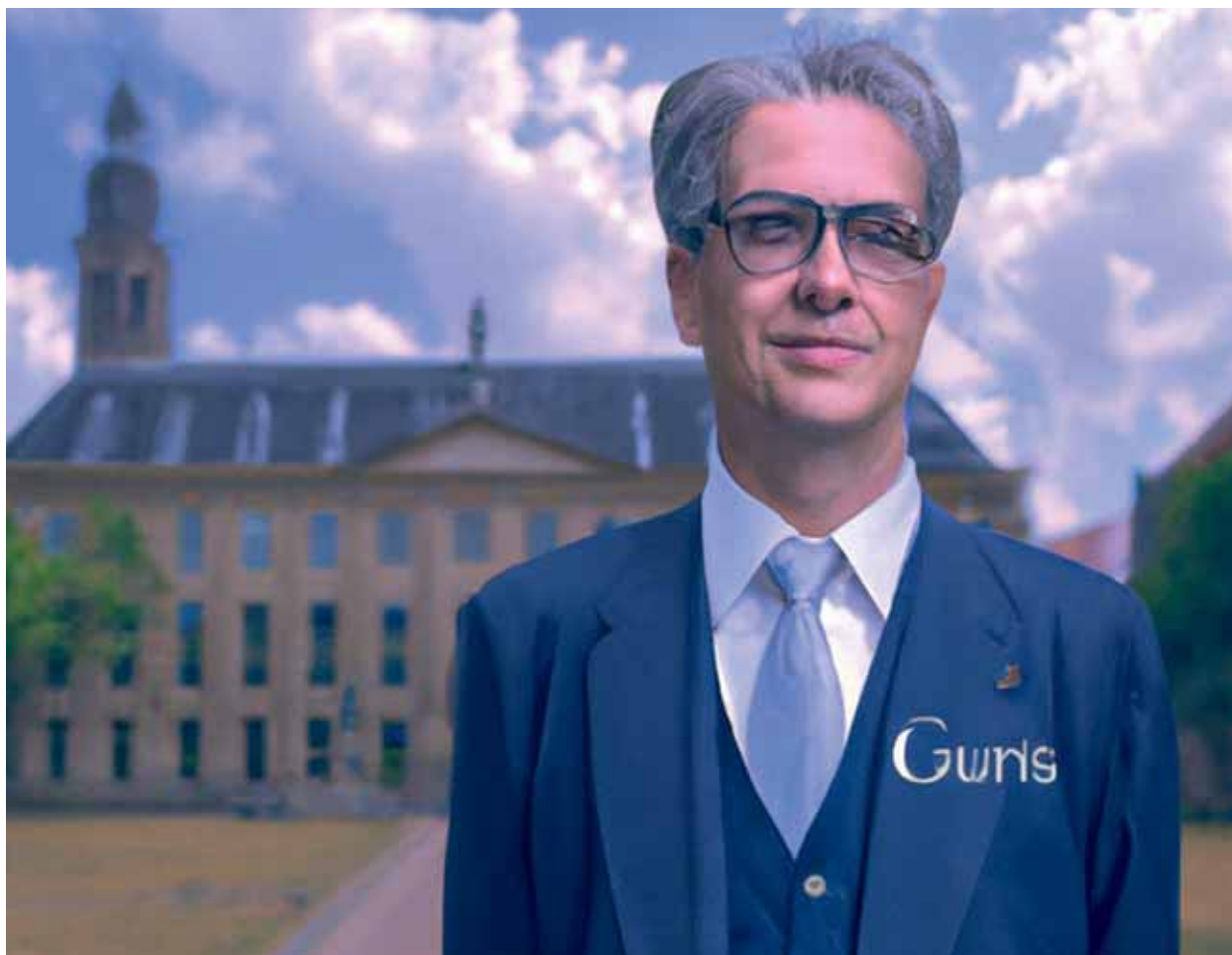
Een door Dall_E 2 vervaardigde afbeelding van 'a professor of copyright law at Leiden University in The Netherlands'. De letters op de revers zijn mogelijk een verhaspeling van 'Getty Images'.