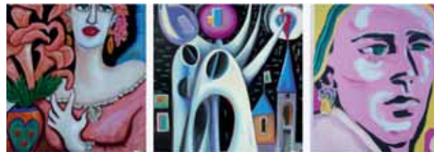
Paintings in the style of Gerdine Duijsens volgens Dall_E 2 (die totaal niet lijken op haar werk).

De grens tussen onbeschermd stijl en auteursrechtelijk beschermde trekken is dun en vaag, en biedt veel ruimte voor interpretatie.