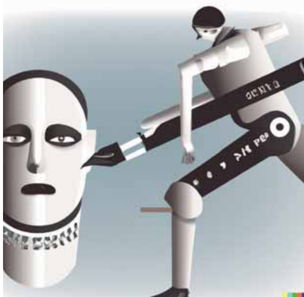
Beeld: Dall_E 2 Instructie: 'A graphic designer afraid of the alleged unfair competition by artificial intelligence in the style of Co Westerik'.

creativiteit vereisen, omdat het in essentie investeringsbeschermingsrechten zijn. Dan hebben we het bijvoorbeeld over het databankenrecht, dat databanken waarin substantieel is geïnvesteerd beschermt tegen het opvragen of hergebruiken (vergelijkbaar met auteursrechtelijk reproduceren en openbaarmaken) van substantiële delen ervan. 58 Het is goed verdedigbaar dat het gebruik van trainingsdata door tekst- en kunstrobots gepaard gaat met het massaal opvragen en hergebruiken van substantiële delen van sommige beschermde databanken. Ook voor het databankenrecht geldt echter een tekst- en datamining-uitzondering met de mogelijkheid van een voorbehoud om de commerciële variant toch te kunnen verbieden. 59 Daarnaast schrijft het HvJ EU in zijn databankrecht-rechtspraak over zoeken, kopiëren en indexerend van vrij op internet toegankelijke databanken inmiddels een oneerlijke mededinging-achtige afweging voor, waarbij getoetst moet worden of de aangevallen handelingen 'schade berokkenen aan [de] investering in de verkrijging, de controle of de presentatie van die inhoud, dat wil zeggen het risico meebrengen dat deze investering niet met een normale exploitatie van de betrokken databank kan worden terugverdiend'. 60 Want: