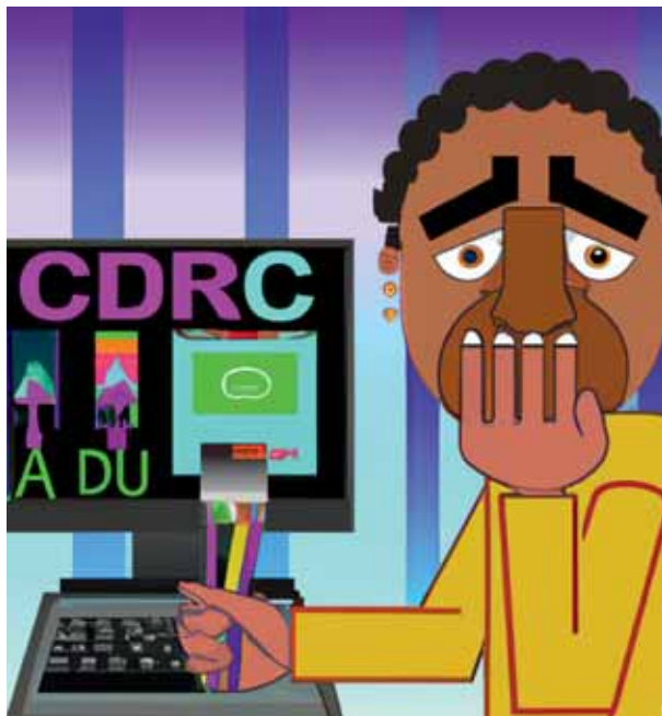
Beeld: Dall_E 2 Instructie (wederom): 'A graphic designer afraid of the alleged unfair competition by artificial intelligence in the style of Co Westerik' (de erven van Westerik hoeven zich nog geen zorgen te maken).