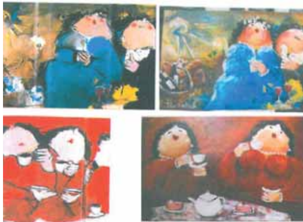
Schilderijen van Duijsens (links) en Broeren (rechts). Auteursrechtinbreuk of (toegestane) stijlnabootsing?

Stijl is dus in beginsel vrij en nabootsing ervan mag zelfs nodeloos verwarring wekken, vond de Hoge Raad tien jaar geleden in een zaak over het nabootsen van een schilderij met gezellige dikke mensen, veelal met een glaasje wijn, als geschilderd door mevrouw Duijsens en nagedaan door de heer Broeren. Het Hof Den Bosch was van oordeel dat er wél sprake was van nodeloos verwarring wekken en daarmee onrechtmatige stijlnabootsing. De Hoge Raad was het daar in 2013 dus niet mee eens.